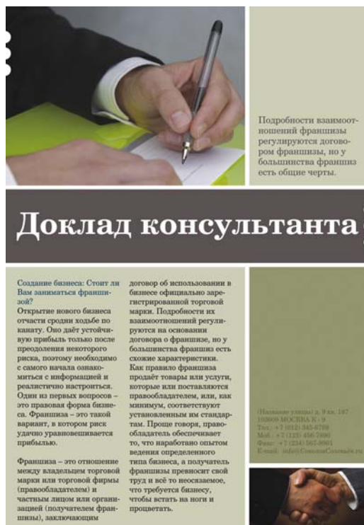
Figura 4: O banner com tipo grande contrasta com o texto do corpo e a foto maior contrasta com a menor. Os elementos são relacionados, mas diferentes, e as diferenças aumentam o interesse visual.

A utilização de contraste é essencial para diferenciar elementos e organizá-los hierarquicamente no design. Contrastando cores, tamanhos, texturas ou tipos, é possível criar uma forte presença visual e chamar a atenção para as mensagens principais. Não diferencie os elementos apenas ligeiramente. Para obter um design eficaz, a diferença entre os elementos deve ser de 180 graus.