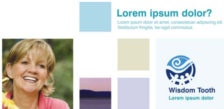
Figura 6: Esta grade modular permite possibilidades ilimitadas de design, mas seu alinhamento mantém o aspecto da página limpo e organizado.