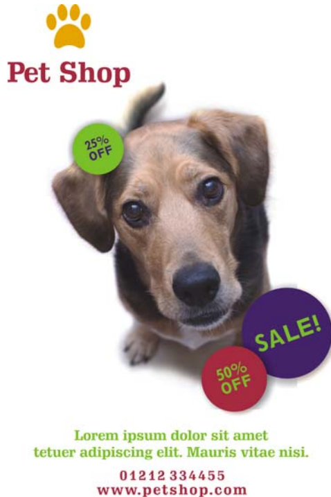
Figura 3: A repetição de temas visuais (como círculos, cores e tipos) ajuda a unificar o design, deixando espaço para a criatividade.

No entanto, é necessário ter cautela com o princípio da repetição: tenha cuidado para não exagerar. Repetir um elemento muitas vezes pode poluir a página e dificultar a compreensão da mensagem. Quando em dúvida, opte pelo simples.