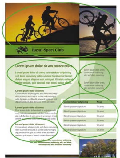
Figura 1: Observe como cada agrupamento de texto e fotos está organizado na página. A proximidade dos itens relacionados ajuda os leitores a navegar pelo conteúdo da página.

De acordo com o princípio de proximidade , itens relacionados devem ser agrupados para formar uma unidade coesa. Aplicando esse princípio, é possível reduzir a desordem e aumentar a clareza. O conteúdo e as mensagens são otimizados, aumentando a probabilidade de os usuários lerem e se lembrarem deles (Figura 1).