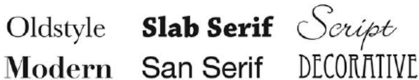
Figura 8: Seis categorias de tipos

Normalmente, os tipos são categorizados com base na presença ou ausência de serifas (pequenos traços finais nas partes superior e inferior da linhas principais que formam cada letra). Embora existam milhares de tipos (muitos para mencionar neste tutorial), a maioria deles pertence a uma de seis categorias (Figura 8).