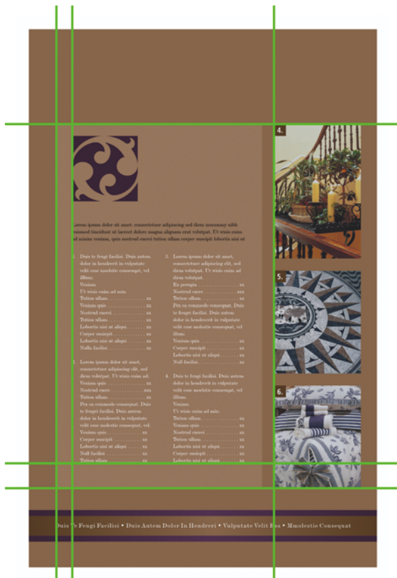
图 2：在页面上对齐元素，可使内容看上去是经过精心思考和组织的，因此值得一读。

一般来说，页面上的关键元素具有焦点的作用，所有其他元素均与其对齐。当您向布局中添加新元素时，请沿着一条不可见的线将两个元素对齐。