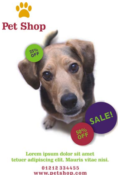
图 3：圆形、颜色和字样等视觉主题的重复 - 帮助您统一设计并保留创造的空间。

用一个词总结有关重复原则的注意事项：过犹不及。重复元素过于频繁会导致页面混乱，且使设计主旨难以理解。如不能确定是否存在上述问题，请保持页面简单。