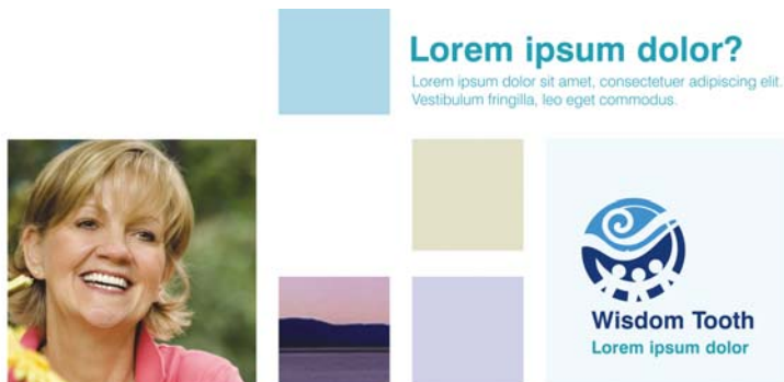
图 6：这种模块网格可以提供无限的设计可能性，并且通过它进行对齐可使页面看上去清晰且富有条理。