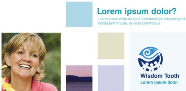
圖 6：模組化格點提供不受限制的 design 可能性，而它的排列方式可讓頁面看起來整齊且有條理。