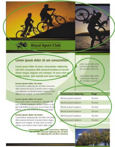
圖 1：注意每組文字和相片在頁面上的安排方式。將相關項目集結起來，有助於讀者瀏覽頁面內容。

集結 原則是指相關的項目應聚集在一起，以形成具有凝聚性的單元。使用這個原則，就能減少凌亂且更為清楚明確。您的內容和訊息簡化許多，讓使用者更願意閱讀並加以記憶（圖 1）。