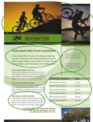
Obrázek 1: Povšimněte si, jak jsou jednotlivé skupiny textů a fotografií na stránce uspořádány. Blízkost souvisejících položek pomáhá čtenáři orientovat se v obsahu na stránce.

Princip blízkosti vyžaduje, aby související položky byly seskupeny dohromady, a tvořily tak soudržný celek. Pomocí tohoto principu můžete omezit zmatek a zvýšit přehlednost. Obsah a zpráva se zjednoduší, a uživatelé si je tak spíše přečtou a zapamatují (obrázek 1).