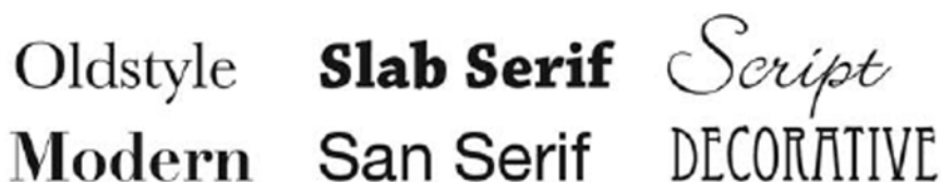
Obrázek 8: Šest kategorií řezů písma

Řezy písma jsou často uspořádány na základě toho, zda (ne)obsahují serify – drobné koncové tahy v horní nebo spodní části hlavních linií, které tvoří každé písmeno. Ačkoliv jsou k dispozici tisíce řezů písem (příliš mnoho na to, abychom je mohli v tomto kurzu všechny zmínit), většina z nich patří do jedné ze šesti kategorií (obrázek 8).