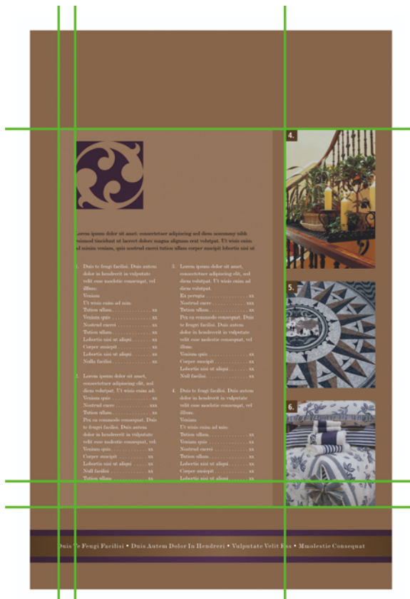
Obrázek 2: Díky uspořádání prvků na stránce působí obsah promyšleně a organizovaně – a tedy stojí za přečtení.

Pravidlem je, že jeden klíčový prvek na stránce funguje jako ústřední bod, se kterým je třeba sladit všechny ostatní prvky. Pokud do rozvržení přidáváte nový prvek, je třeba oba prvky sladit podél neviditelné linie.