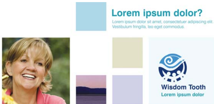
Obrázek 6: Tato modulární mřížka přináší neomezené možnosti designu, díky jejímu uspořádání však stránka vypadá čistě a přehledně.