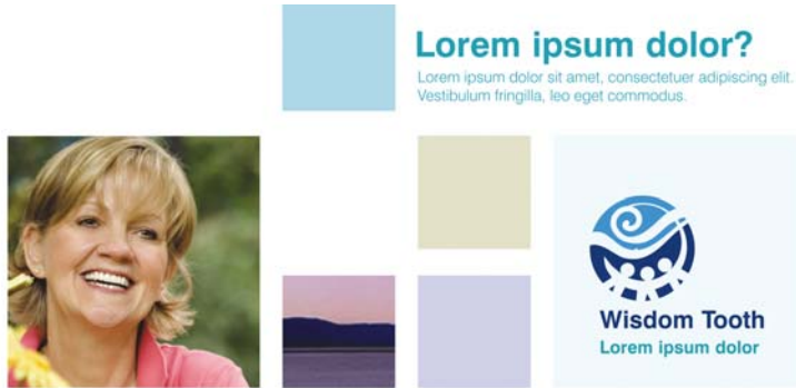
図6: このモジュールグリッドにより、デザインのアライメントを維持し、ページがすっきりとよく整理されて見えるようになります。