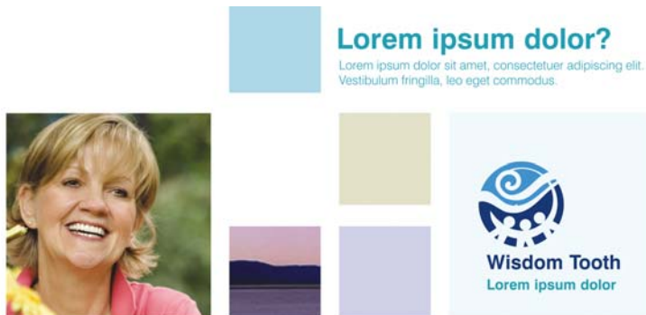
Рис. 6. Эта модульная сетка предоставляет безграничные возможности для создания макета, при этом ее выравнивание позволяет сохранить четкость и упорядоченность страницы.