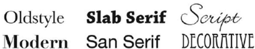
Рис. 8. Шесть категорий гарнитур шрифтов

Шрифты часто подразделяются по наличию или отсутствию засечек – небольших конечных штрихов в верхней и нижней частях линий, образующих каждую букву. Хотя гарнитур существуют тысячи (слишком много, чтобы перечислять их в данном пособии), большинство из них принадлежит к одной из шести категорий (рис. 8).