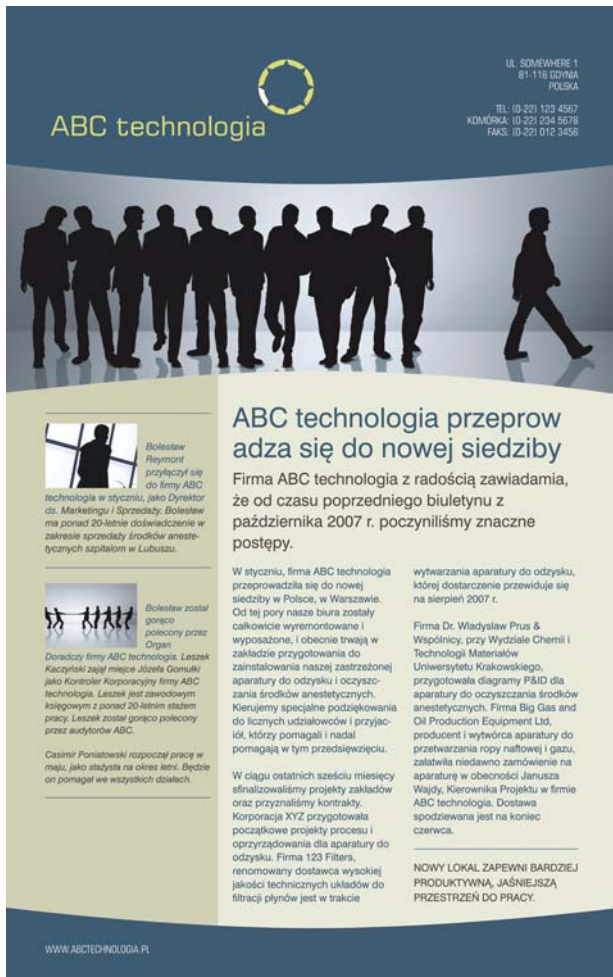
Рис. 7. Внимание читателя привлекает текст справа, имеющий более крупный заголовок и шрифт. Содержимое левого бокового столбца менее важно, поэтому текст напечатан шрифтом меньшего размера и на фоне другого цвета.

Способ расположения (упорядочивания) содержимого – центральная составляющая процесса создания макета. Для привлечения внимания читателя к наиболее важной части содержимого можно использовать размер, плотность, расположение и интервалы. Этот аспект компоновки называется иерархией макета. Примеры иерархической компоновки можно увидеть в газетах, журналах и на плакатах (рис. 7).